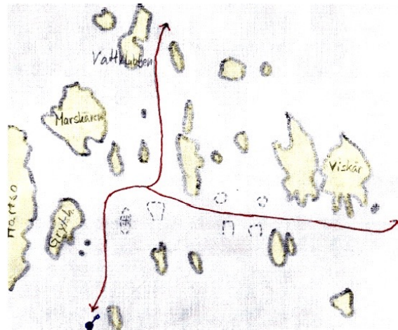
Bojen vid Hartsö